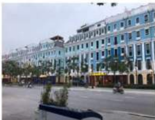
Khách sạn "ZO D'BOUTIQUE HEOTEL."