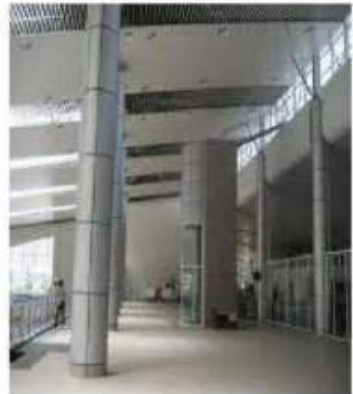
Ốp cột nhôm và trần