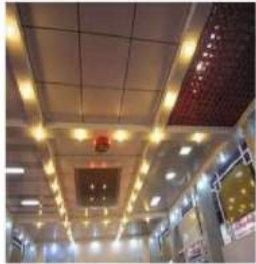
Trần nhôm trong nhà