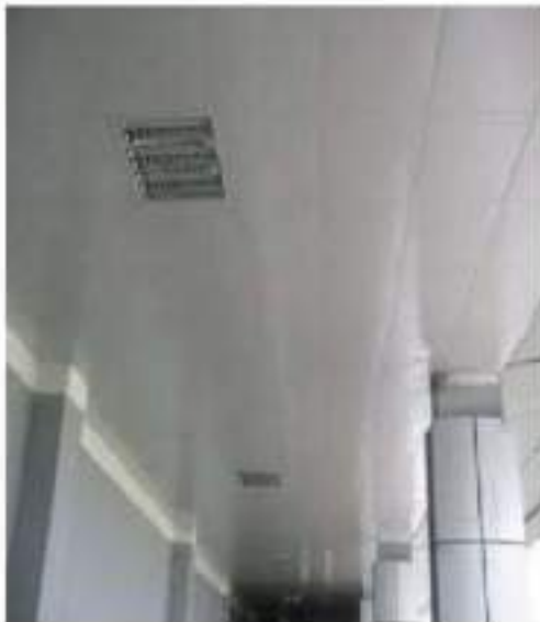
Trần hợp kim nhôm