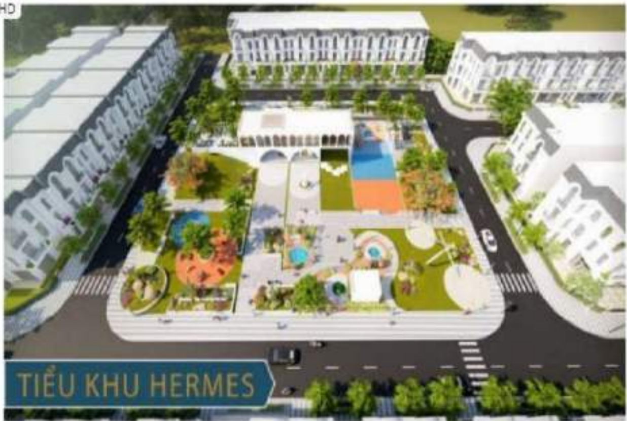
Phối cảnh tiểu khu Hermes trong tổng thể tổ hợp Thái Hưng Eco City