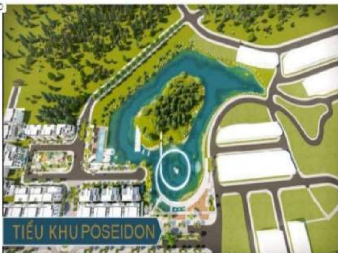
Phối cảnh tiểu khu Poseidon - tiểu khu cuối cùng trong khuôn viên Thái Hưng Eco City